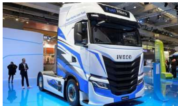
GLOBAL REACH. Iveco will gain access to TML's distribution network across India, South Asia, Africa and parts of West Asia

With only financial regulatory approvals in France and Spain pending, Tata Motors Ltd (TML) has, for the first time, outlined how it plans to integrate Iveco following its €3.8 billion acquisition.